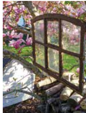
In Höltings Garten

Gästehaus Hölting · Mühlenstr. 3 · Lübberstedt