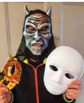
Hinter der Maske

Bremer Straße 4 · Hambergen Tel. 04793 - 7871 30 (AB)