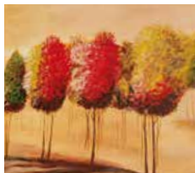
Der Herbst ist bunt

Am Jantzen Park 49a · Hambergen Tel. 04793 - 953 979