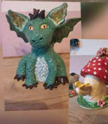
Kreativität aus Ton