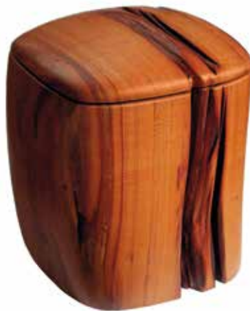
Urne aus Pflaumenholz