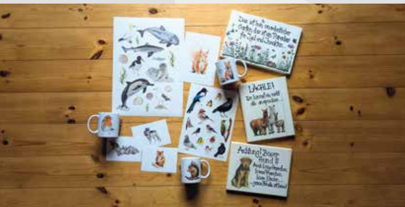
Eine kleine Auswahl