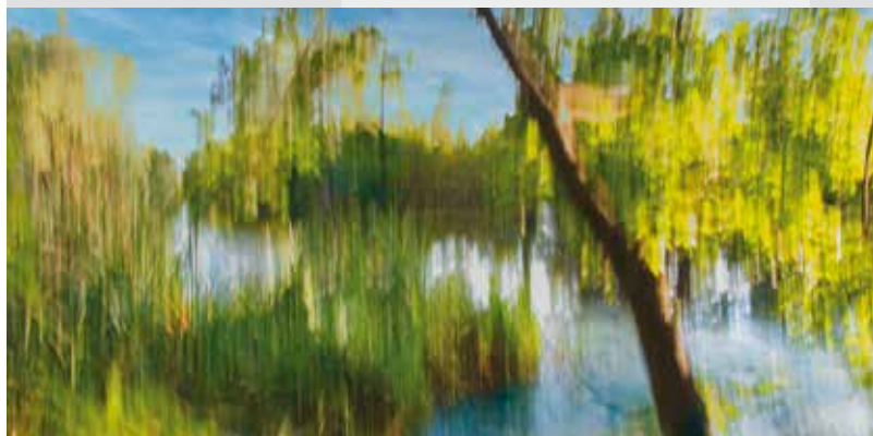
Wasserufer – ICM-Fotografie

Anke Fiedler Tel. 04793 787 015 · touristik@hambergen.de