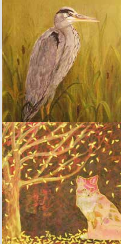
Graureiher - Acryl

Tel. 04793 432 296 9 · info@sportforum-hambergen.de www.sportforum-hambergen.de