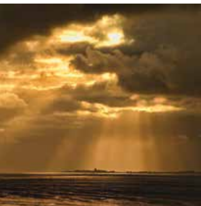
Blick auf Neuwerk