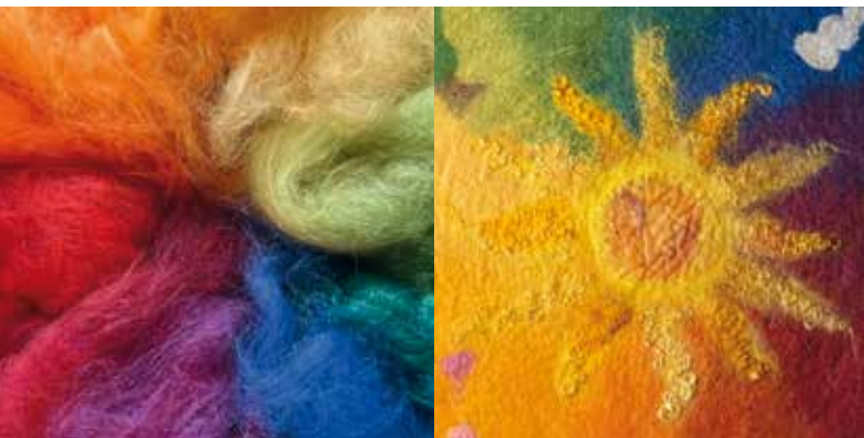
Am Kardierbrett gem. Wolle