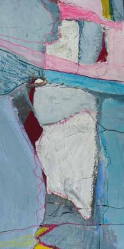
Ausschnitt aus Collage o. T.